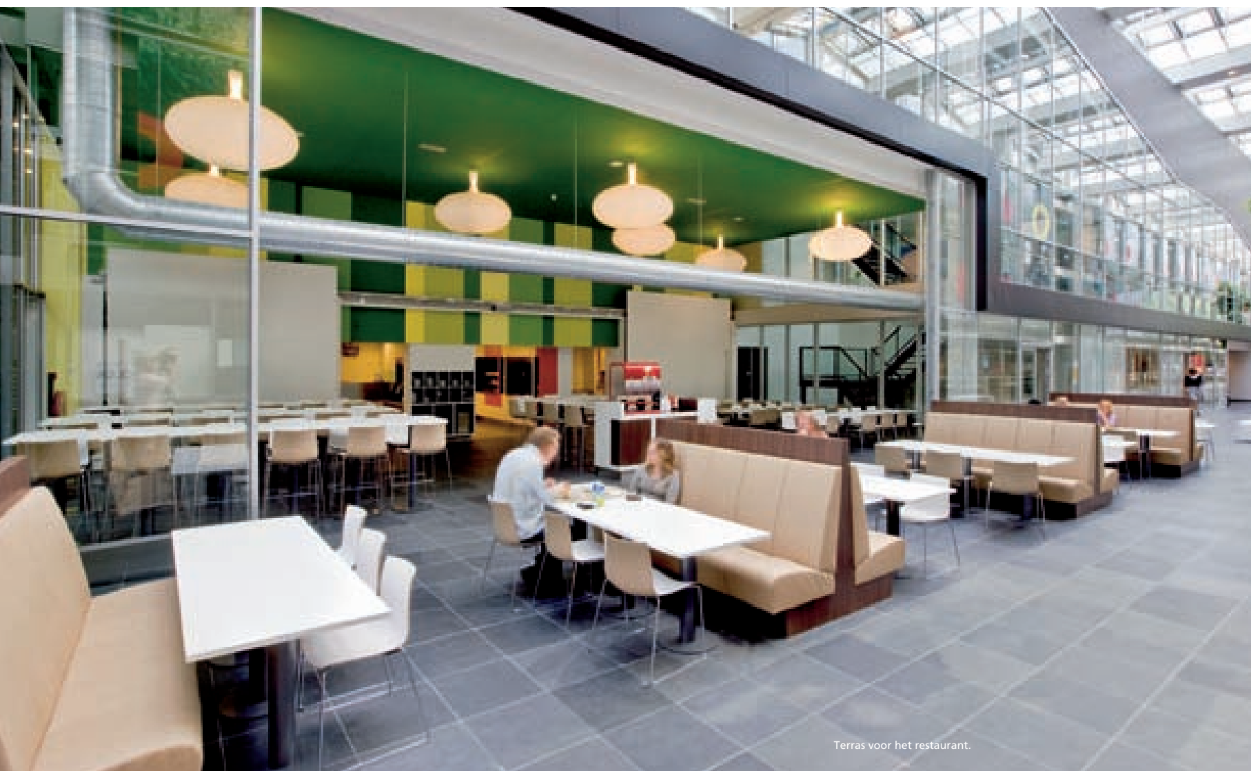
Terras voor het restaurant.

Sinds januari is het hoofdkantoor van PCM Uitgevers gevestigd in bedrijfsverzamelgebouw INIT in Amsterdam. Binnen de gegeven structuur van dit gebouw creëerde Heyligers design+projects op 15.000 m 2 een herkenbaar kantoor met circa 900 werkplekken. De opdracht was om de verschillende redacties een eigen plek te geven en tevens één bedrijf te maken van PCM. Het kleurrijke resultaat viel in de smaak, al moesten velen wennen aan de openheid die het transparante interieur met zich meebracht.