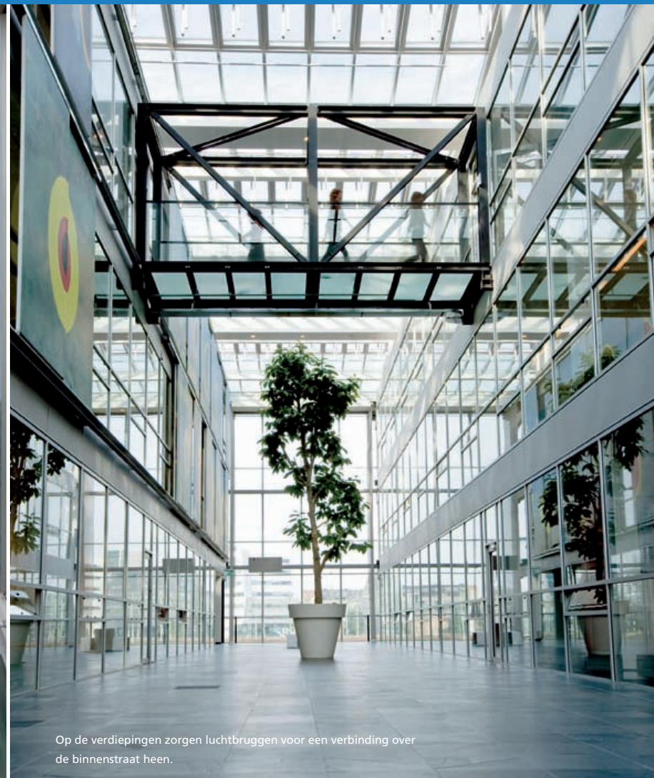
Op de verdiepingen zorgen luchtruggen voor een verbinding over de binnenstraat heen.

de verbinding naar het volgende blok. Daarmee ontstond tevens de mogelijkheid om het middengebied van ieder blok bijzondere functies te geven. "Het is eigenlijk een onhandig gebouw", oordeelt Heyligers over het veelbesproken ontwerp van Groosman Partners Architecten. "De etages zijn 22,5 meter diep, waardoor er op een groot deel van de werkvloer heel weinig daglicht komt. In dat middengebied hebben we dan ook in principe geen vaste werkplekken ingericht, maar archief ruimten, concentratiewerkplekken en vergader ruimten." Om de nodige kabels en leidingen weg te werken is de vloer in het middengebied iets verhoogd. Optisch wordt deze verhoging tegengegaan doordat het tapijt hier een donkerdere tint kreeg.