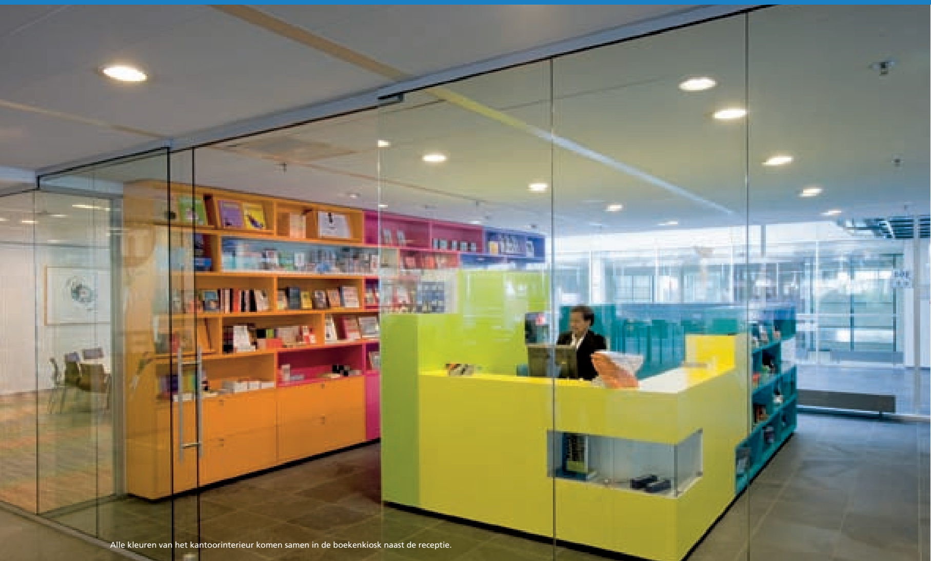
Alle kleuren van het kantoorinterieur komen samen in de boekenkiosk naast de receptie.