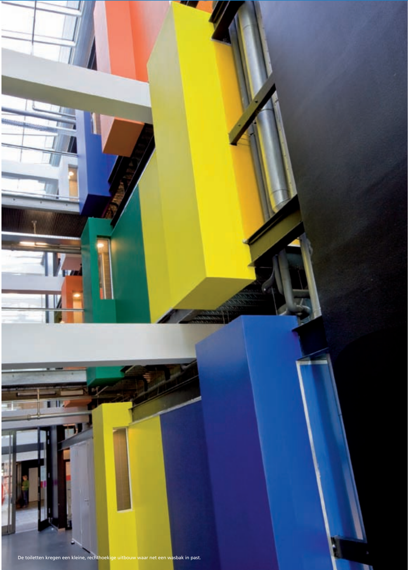
De toiletten kregen een kleine, rechthoekige uitbouw waar net een wasbak in past.