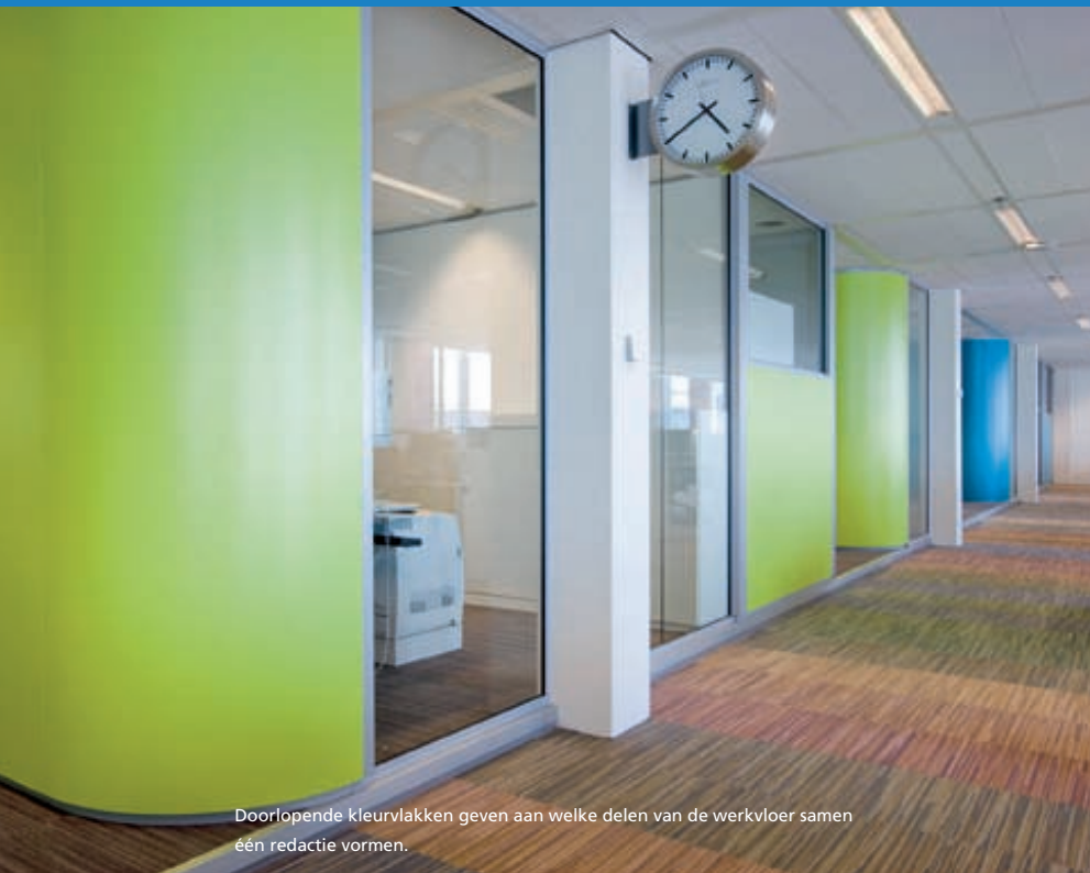
Doorlopende kleurvlakken geven aan welke delen van de werkvloer samen één redactie vormen.