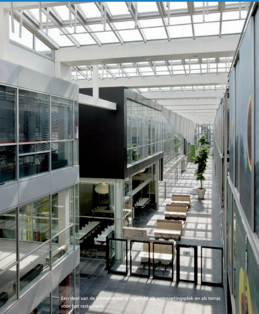
Een deel van de binnenstraat is ingericht als ontmoetingsplek en als terras voor het restaurant.