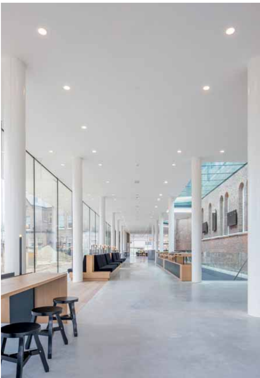
Heyligers d+p verwerkte in het interieur verwijzingen naar de kerk, zoals de lampen in kaarsvorm links op de foto.