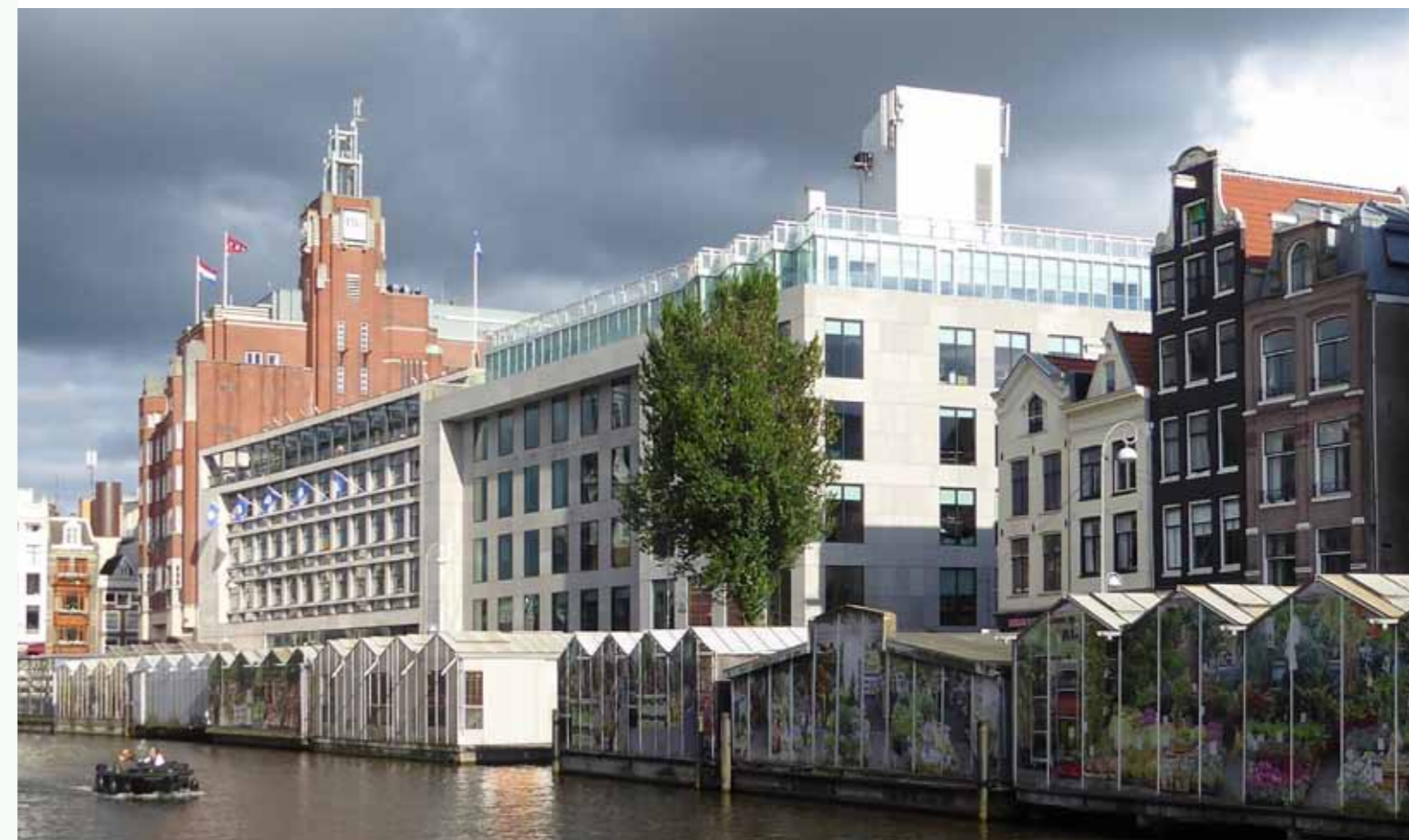
Bloomhouse, Singel, Amsterdam, renovatie exterieur