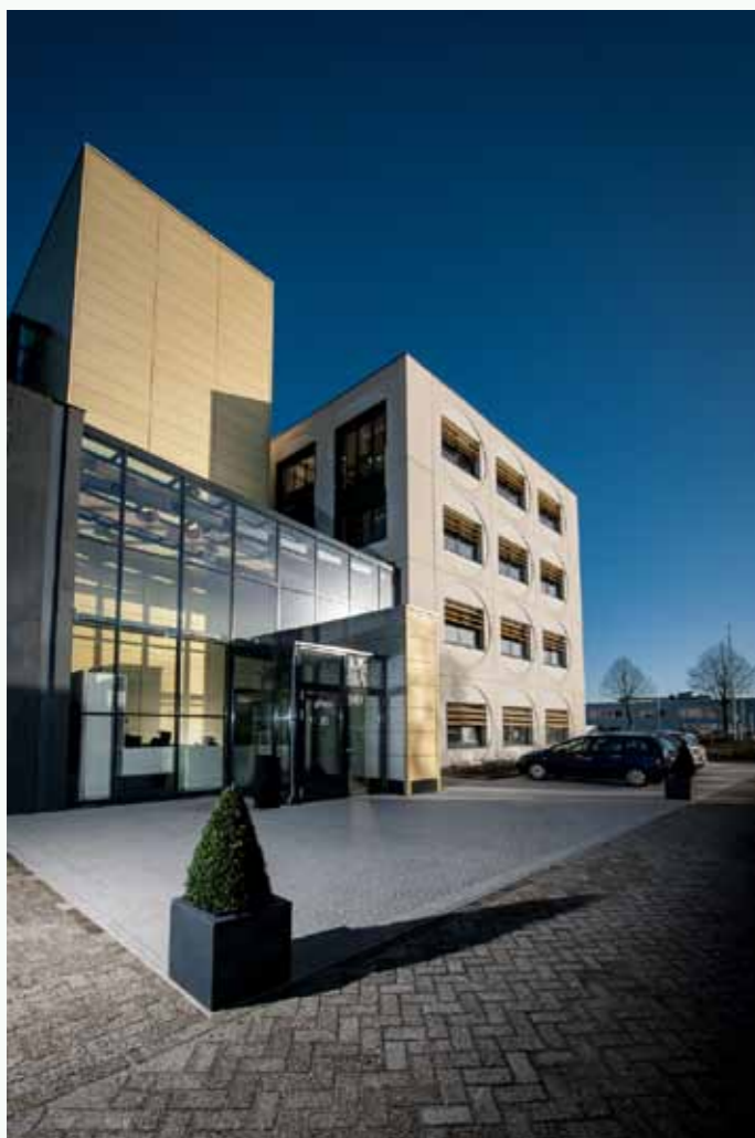
Kantoor Greetz Amsterdam Zuidoost, in- en exterieur.