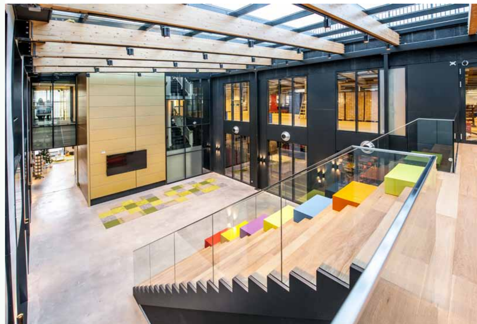
Kantoor Greetz Amsterdam Zuidoost, in- en exterieur.

VANUIT GEBRUIK DENKEN _ Dat HEYLIGERS d+p van origine interieurarchitect is, bleek ook een voordeel bij de