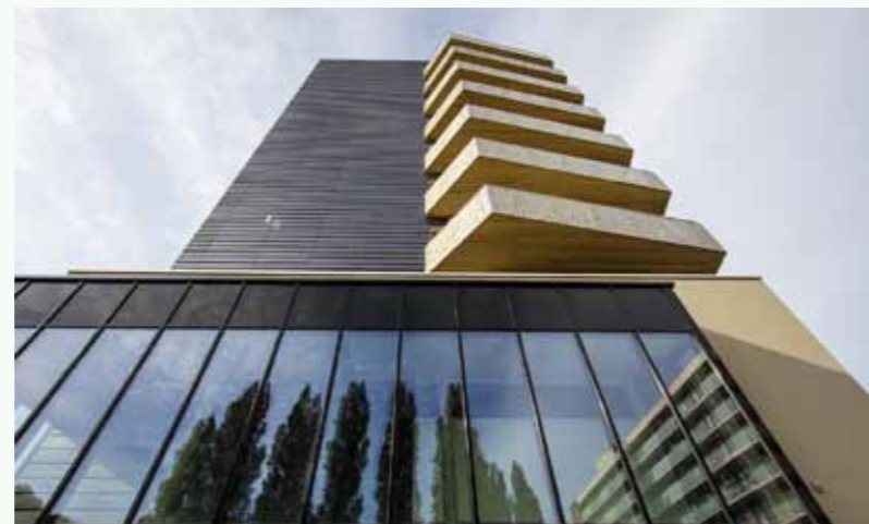
Kostverlorenhof Amstelveen, renovatie exterieur