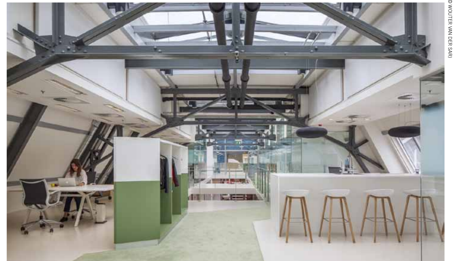
Ripe Amsterdam, interieurconcept in gerenoveerd industrieel pand.