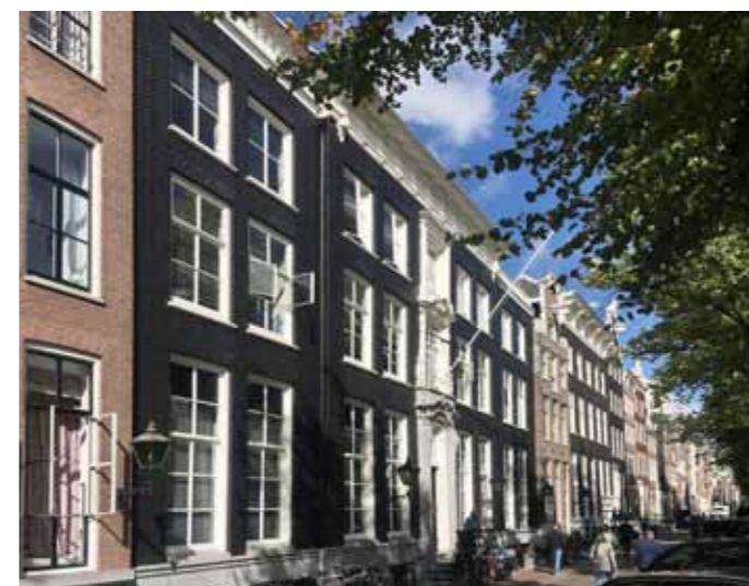
Voormalig kantoorpand Keizersgracht Amsterdam, renovatie en transformatie, in- en exterieur.

transformaties. Lonneke Leijnse: 'Voor ons is denken vanuit het directe gebruik volkomen vanzelfsprekend. Dat is immers van nature het geval met interieurontwerp. Dat uitgangspunt, die zienswijze, blijkt ook heel goed te zijn bij de transformatie van gebouwen. Het is eigenlijk een "schil" verder dan wat we normaal doen. Er komt een bouwkundige schil bij als je transformaties doet. En ook daar proberen we net als bij interieurontwerp uit te gaan van flexibel gebruik. Waarbij wij ook vaak het liefst gemengd gebruik in een gebouw zien. Dat past bij de huidige tijd. En het geeft levendigheid en continuïteit aan een gebouw.'