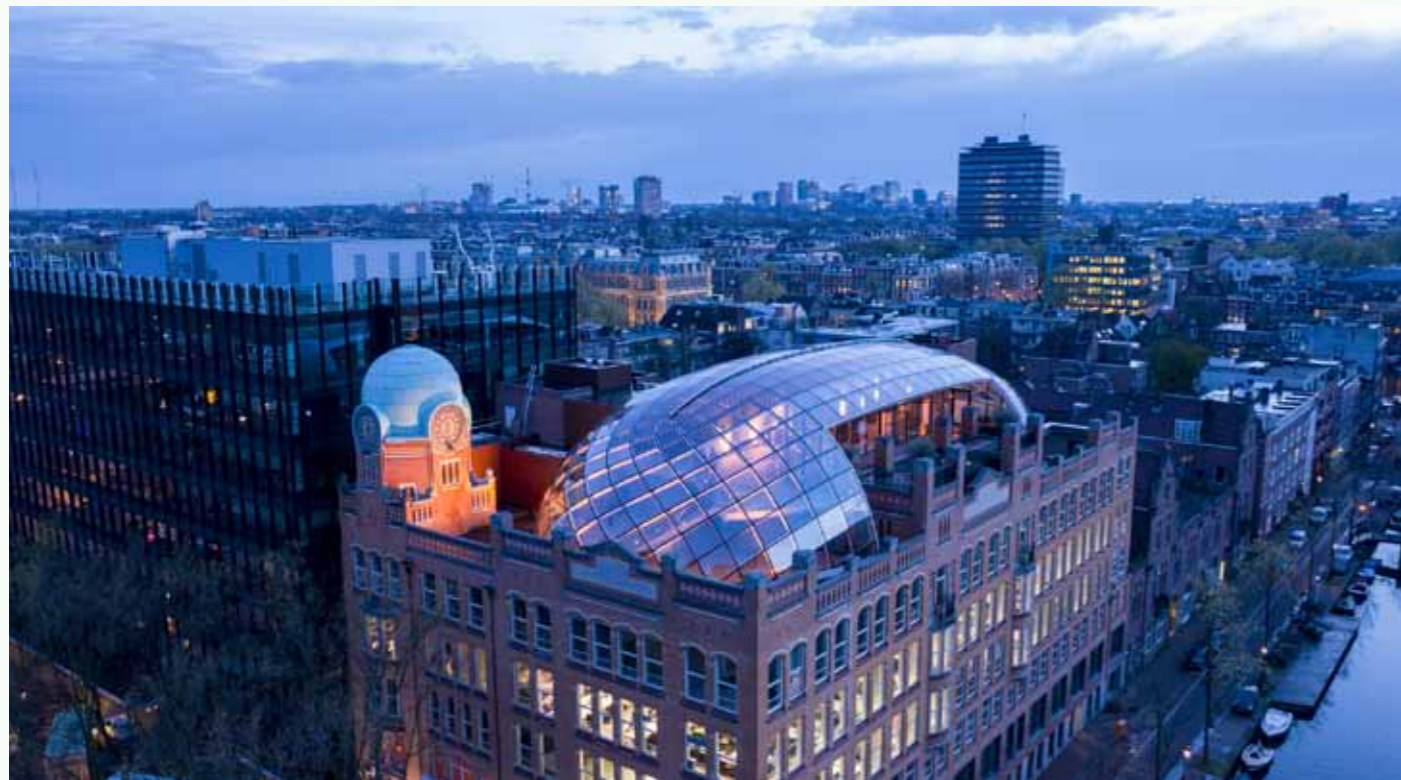
Diamantbeurs Amsterdam transformatie en renovatie ism Zwarts & Jansma Architects